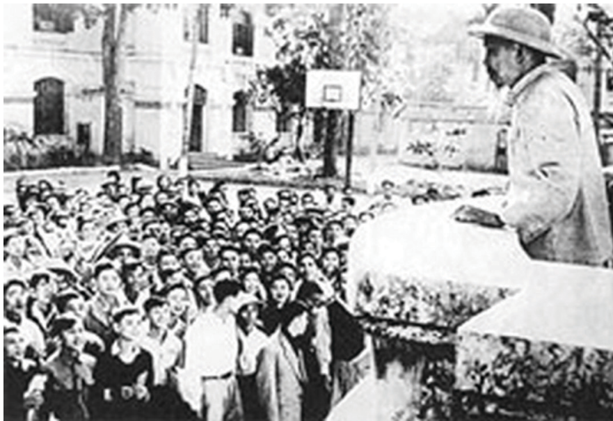
Hồ Chủ tịch với cán bộ sinh viên Trường Đại học Tổng hợp Hà Nội.

mô hình đại học đa ngành, đa lĩnh vực của Đại học Đông Dương.