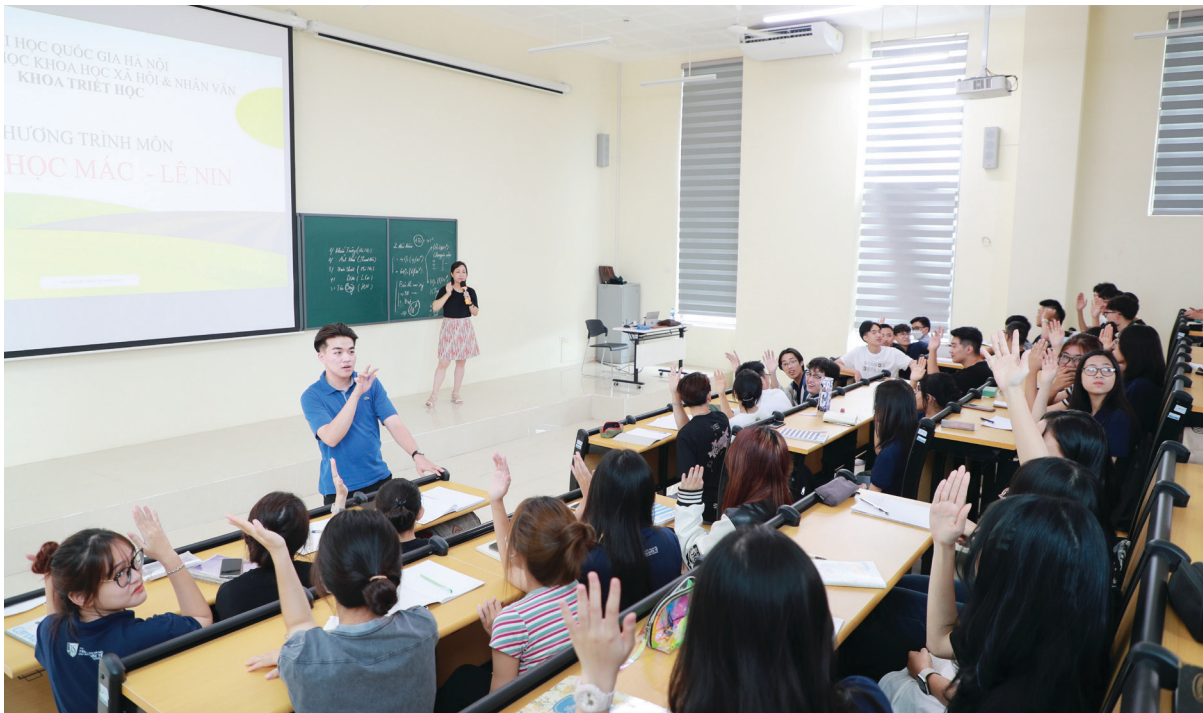
Sinh viên ĐHQGHN học tập tại Khu đô thị ĐHQGHN ở Hòa Lạc.

Đại học Đông Dương và Trường Đại học Quốc gia Việt Nam, hay được đào tạo ở nước ngoài về. Có thể kể ra một số tên tuổi tiêu biểu nhất trong các lĩnh vực khoa học tự nhiên và khoa học xã hội như Nguyễn Kon Tum, Lê Văn Thiêm, Đặng Thai Mai, Trần Đức Thảo... Trải qua gần 4 thập kỷ phát triển, Trường Đại học Tổng hợp Hà Nội đã có những đóng góp xuất sắc vào sự nghiệp xây dựng và bảo vệ Tổ quốc, xứng đáng là trường đại học khoa học cơ bản hàng đầu của cả nước.