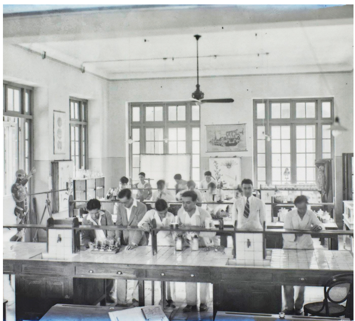
Phòng thí nghiệm của Đại học Đông Dương