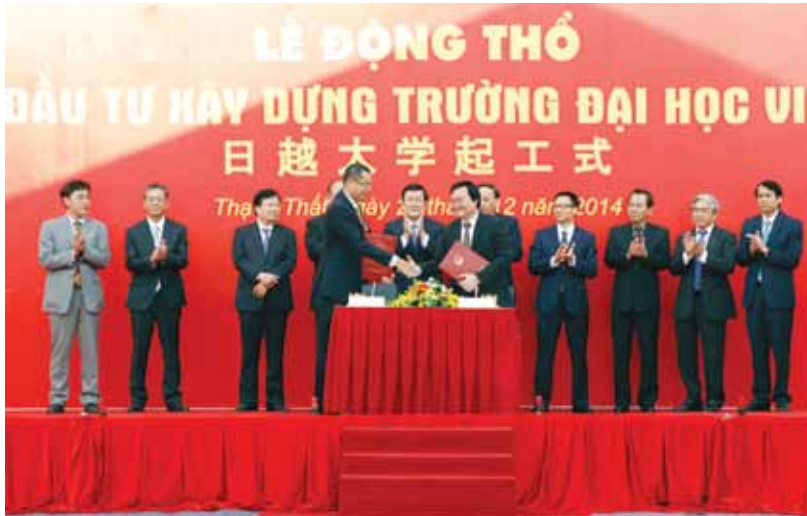
Lễ động thổ xây dựng Trường ĐH Việt Nhật trong khuôn viên ĐHQGHN tại Hòa Lạc

Đồng thời, công tác nắm bắt tình hình tư tưởng của sinh viên đối với các vấn đề lớn của đất nước, cũng như trước những vấn đề nhạy cảm liên quan đến chủ quyền quốc gia đã được Đảng ủy, Ban Thường vụ Đảng ủy chỉ đạo làm tốt thông qua những hoạt động thiết thực giúp các em có nhận thức đúng đắn, tích cực về trách nhiệm của tuổi trẻ trong sự nghiệp xây dựng và bảo vệ Tổ quốc.