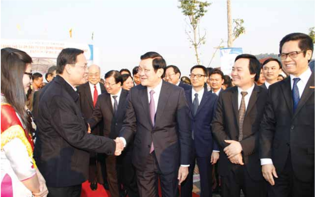
Chủ tịch nước Trương Tấn Sang dự lễ động thổ Trường ĐH Việt Nhật tại Hòa Lạc

điều kiện được đầu tư tương xứng với tầm quan trọng của lĩnh vực này.