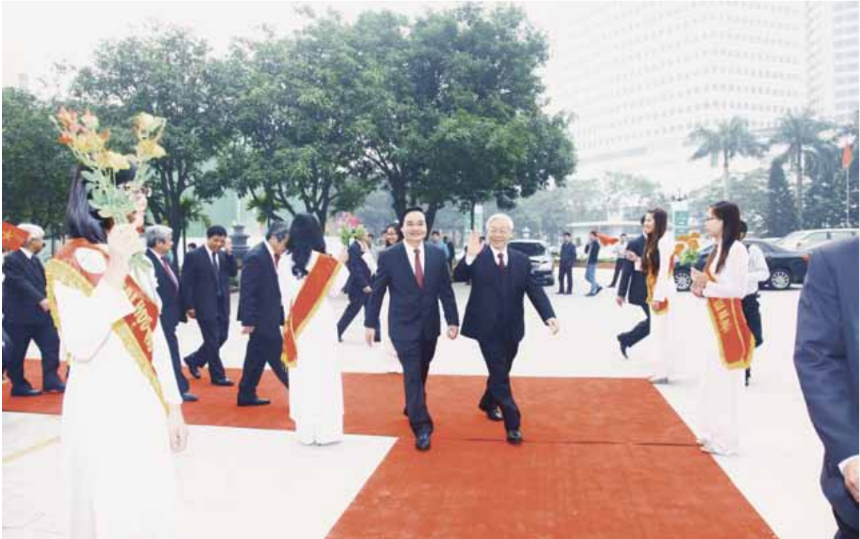
Tổng Bí thư Nguyễn Phú Trọng trong lần về thăm và làm việc với ĐHQGHN

ngiên cứu. Công tác phát triển đội ngũ công chức, viên chức, đặc biệt là đội ngũ các nhà khoa học trong nhiệm kỳ vừa được quan tâm, đẩy mạnh. Một số chính sách thu hút cán bộ giỏi từ bên ngoài và “giữ chân” cán bộ hiện có đã được ban hành và triển khai tương đối hiệu quả. Nhờ vậy, đội ngũ cán bộ khoa học của ĐHQGHN có trình độ tiến sĩ, tiến sĩ khoa học tăng đáng kể, từ 38% năm 2010 lên 47% năm 2014, riêng đối với các lĩnh vực khoa học tự nhiên, công nghệ và kinh tế, tỉ lệ này đạt trên 70%; tỉ lệ cán bộ khoa học có chức danh giáo sư, phó giáo sư đạt 20,6% tổng số cán bộ khoa học, cao hơn khoảng 3 lần so với tỉ lệ trung bình của cả nước.