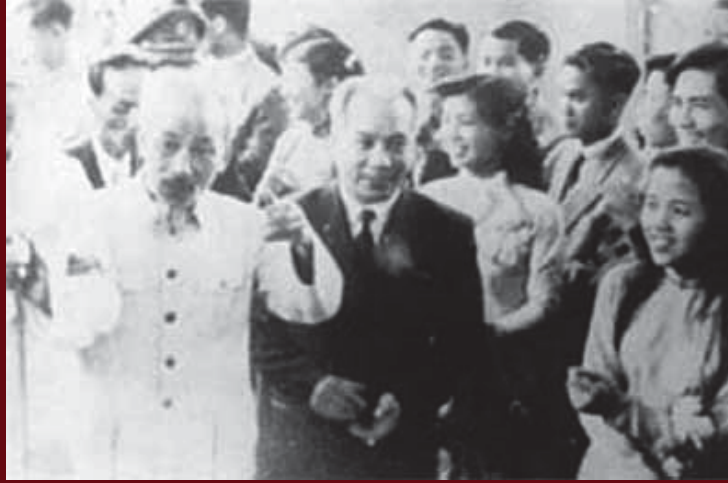
>> Hồ Chủ tịch thăm Trường ĐH Tổng hợp Hà Nội