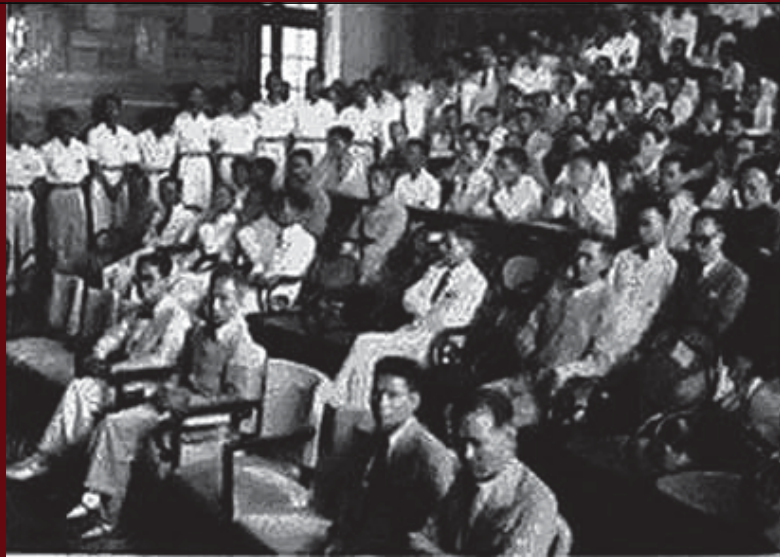
>> Hồ Chủ tịch dự Lễ khai giảng của Trường Đại học Đông Dương (nay là ĐHQGHN)

"THỰC TIỄN PHÁT TRIỂN GẦN 20 NĂM QUA CỦA HAI ĐHQG, ĐẶC BIỆT LÀ CỦA ĐHQGHN LÀ NHỮNG MINH CHỨNG HỮNG HỒN CHO THẤY ĐÂY LÀ NHỮNG QUYẾT ĐỊNH HOÀN TOÀN ĐÚNG ĐẮN CỦA ĐẢNG VÀ CHÍNH PHỦ, VỪA KẾ TỤC TƯ DUY, TÁM NHÌN CHIẾN LƯỢC CỦA CHỦ TỊCH HỒ CHÍ MINH, VỪA PHÙ HỢP VỚI YÊU CẦU KHÁCH QUAN CỦA ĐẤT NƯỚC VÀ THỜI ĐẠI."