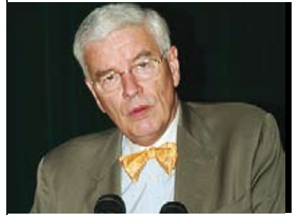
>> Ngài Đại sứ Pháp tại Việt Nam